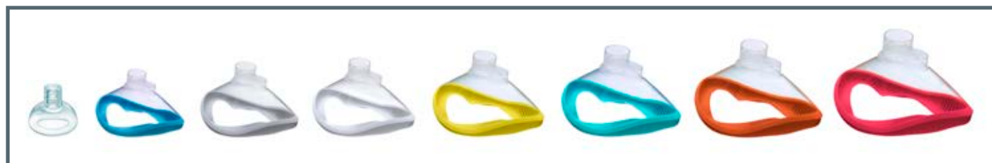
Maschere facciali monouso Ambu® Open Cuff misure 0-7