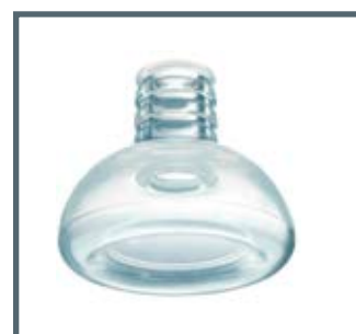
Maschere facciali monouso Ambu® Open Cuff misura 0, di forma rotonda e flessibile per neonati prematuri