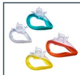
Maschera facciale monouso Ambu® Open Cuff misure 3, 4, 5, 6