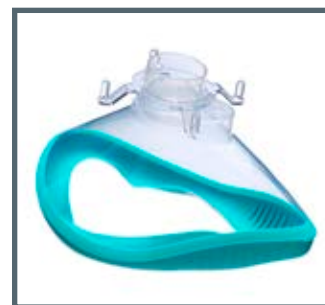
Maschera facciale monouso Ambu® Open Cuff