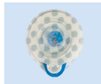
Liner di rilascio stampato