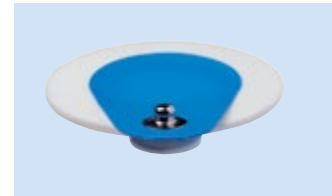
S = Bottone