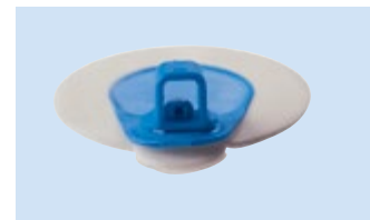
A = Connettore 4 mm