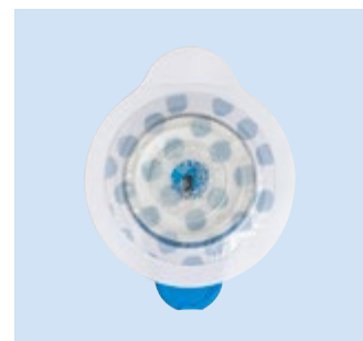
Liner di rivestimento stampato