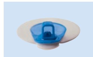
A = Connettore 4 mm