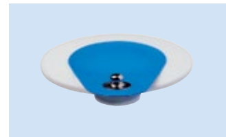
S = Bottone