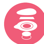
Sensore in argento