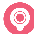
Doppio anello adesivo