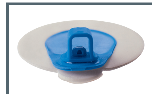
A = innesto a banana 4 mm