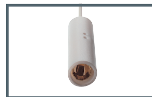
F = 3 mm