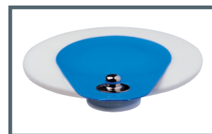
S = bottone