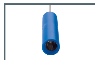
A = 4 mm