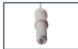
K = 1,5 mm