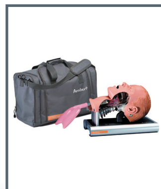
Borsa per il trasporto

Ambu A/S Baltorpbakken 13 DK - 2750 Ballerup Denmark Tel. +45 7225 2000 Fax +45 7225 2053 www.ambu.com