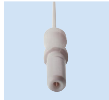
K = Connettore 1.5 mm