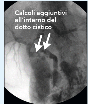
Figura 3: Fluoroscopia che mostra calcoli aggiuntivi all'interno del dotto cistico che drena in modo anomalo.

Il catetere a palloncino è stato fatto avanzare attraverso il dotto cistico nella cistifellea aiutato da filo guida, ma i tentativi di rimozione dei calcoli non sono riusciti. I calcoli sono stati quindi spinti nella cistifellea sciaccando il dotto cistico con soluzione salina.